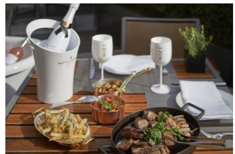
フードとドリンクのイメージ

- シャンパン、白ワイン、赤ワイン、ロゼワイン、スピリッツ、カクテルのフリーフロー