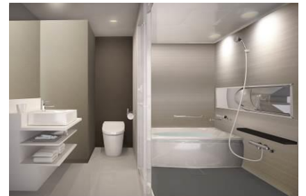
独立型バスルーム(イメージ)