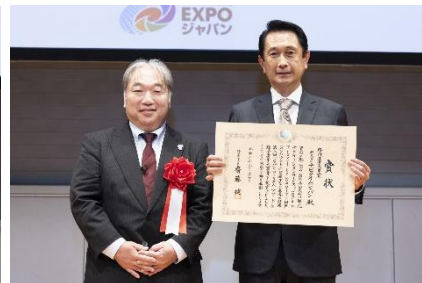
第8回（2024年）経済産業大臣賞 株式会社ナビタイムジャパン 訪日外国人向け観光ナビゲーションサービス 『Japan Travel by NAVITIME』（インバウンド）