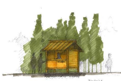
堀部安嗣 「つばや」 イメージ画像