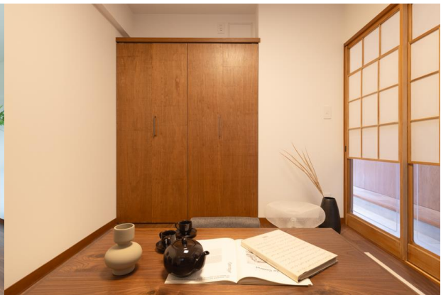
『湯島ハイタウン』通り土間・R型キッチン(左)／洋室(1) 古材の雪見障子(右)