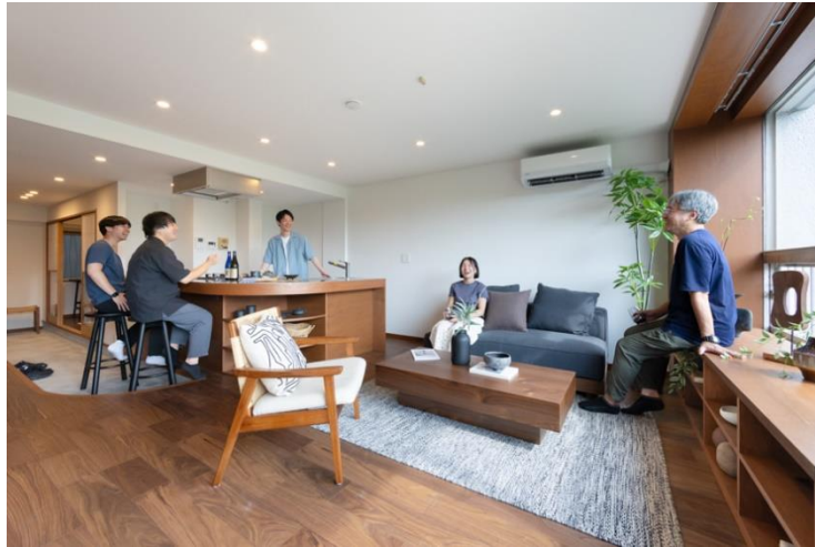
『湯島ハイタウン』リビング・ダイニング・キッチン

本住戸では、暮らしの中に「ひとり」と「誰か」の間、「閉じる」と「開く」の間など明確に分けずにゆるやかに行き来できる“間(ま)”を設け、人との距離感を柔軟に選べる空間を意識して設計しています。