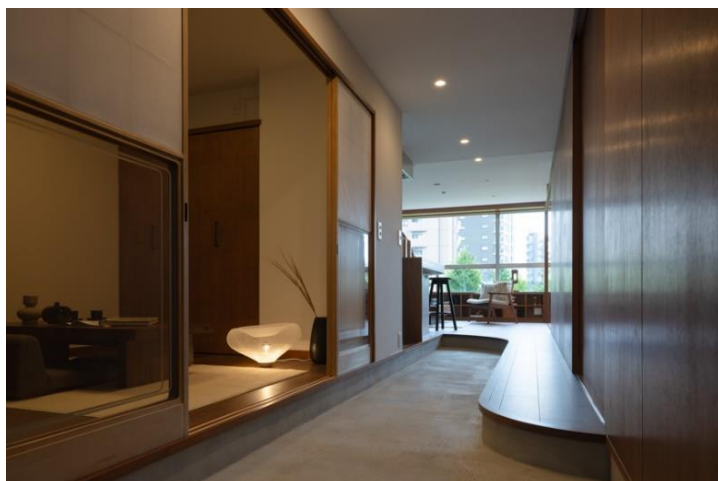
都市部の孤独に寄り添う“間(ま)” 『湯島ハイタウン』 土間・洋室(1)