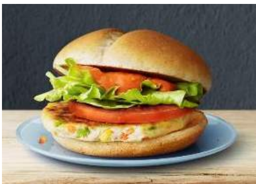
「ベジタブルチキンバーガー」

加えて、お子様向けメニューとして人気の「ハッピーセット」に新商品が登場します。マクドナルドでも、お子様にもっと野菜を取り入れた食事をさせたいというお母様の声を受けて開発した新メニューとして、チキンと野菜を使った美味しいグリルパティを取り入れた「モグモグマック」を、11年ぶりのハッピーセット向け新メインメニューとしてラインナップしました。