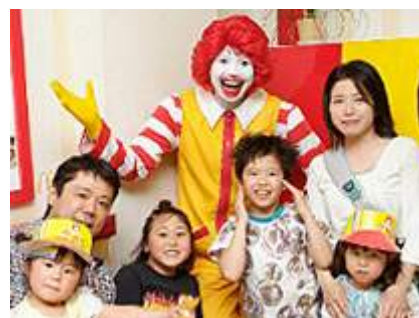
「ドナルドアピアランス」