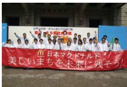
「クリーンパトロール」