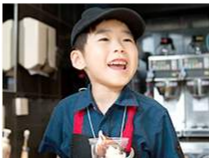
「マックアドベンチャー」

「地域の皆様に貢献する活動」では、店舗近隣の清掃活動を行う「クリーンパトロール」や、学童野球や少年サッカーといった地域スポーツの支援、新小学一年生に防犯笛を贈呈するといった地域コミュニティと連携した活動を推進してまいります。