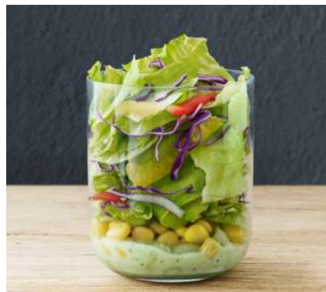
「サイドサラダ バジルソース」