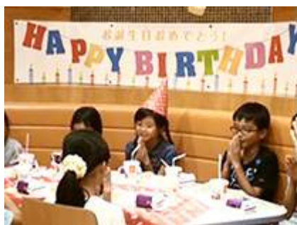
「バースデーパーティー」