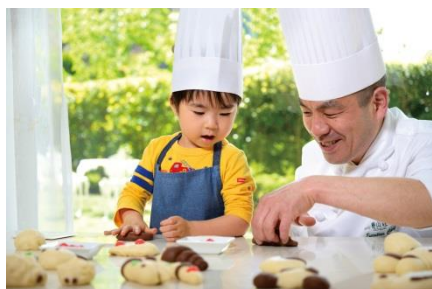
「パン&スイートポテト作り体験」