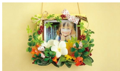
「フラワーフォトスタンド作り」