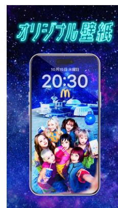
第一弾：オリジナル壁紙

10月1日(水)より、第一弾として、特設サイトから「青いマックの日 × XG」の限定オリジナル壁紙をダウンロードいただけます。また、10月16日(木)からは、第二弾として、マクドナルド公式アプリ内の特設サイト「GALAXY STATION」からエントリー(初回のみ)後、公式アプリからモバイルオーダー・マックデリバリーサービスで「BLUE GALAXY SET」を1回以上ご注文・ご購入いただくことで、購入特典の特別版の壁紙がもらえます。