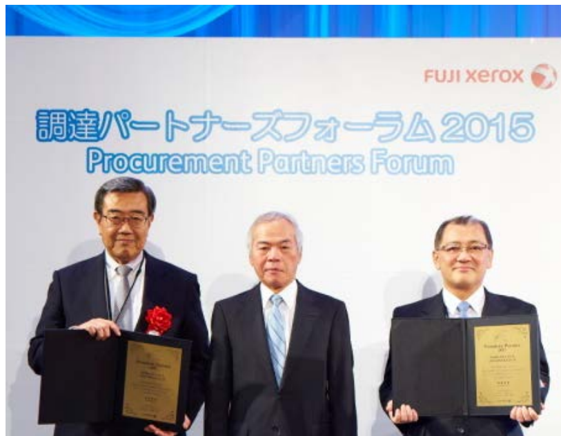
パートナーズフォーラムの様子

当社は富士ゼロックス社へ環境対応型低炭素鉛フリー快削鋼（*後述）や表面処理鋼板を納入しており、技術・品質面のみならず、安定供給力や環境経営における当社マネジメント姿勢項目においても高い評価を頂きました。