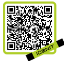
【月刊『ヒーローズ』専用 QR コード】