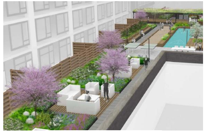
2階中庭イメージパース