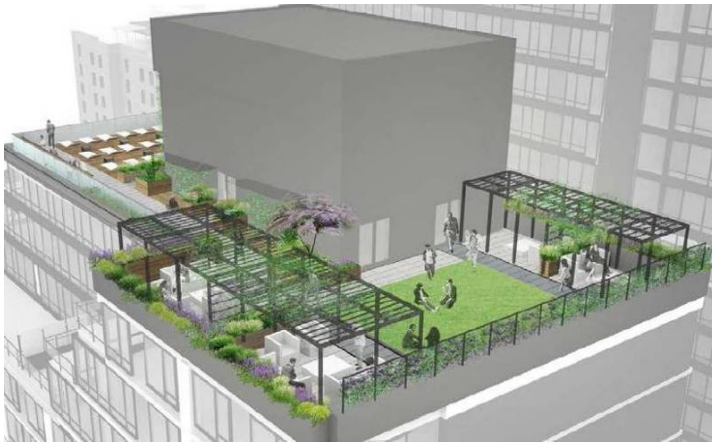
南棟ルーフトップテラス イメージパース