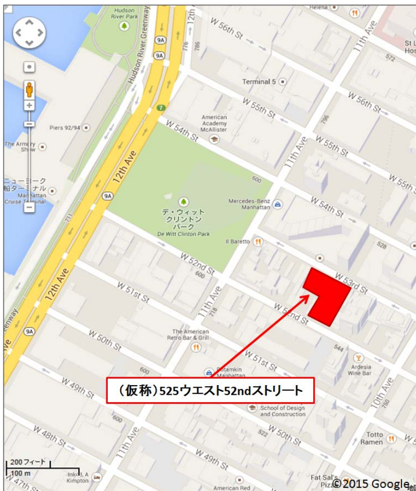
広域図内の赤枠点線部分の詳細図