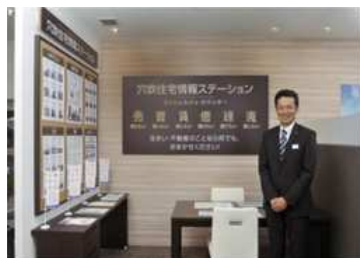
「住宅情報ステーション」 コンシェルジュ・カウンター