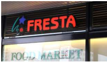
フレスタ呉駅ビル店 徒歩7分（約560m）

また、毎日のお買い物に便利なスーパーはもちろん、「れんが通り商店街」や「ポポロショッピングセンター呉館」、駅ビル「クレスト」、大型ショッピングセンター「ゆめタウン呉」など、商業施設が徒歩圏内に充実しています。