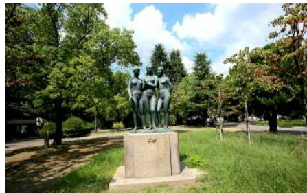
中央公園 徒歩3分（約240m）