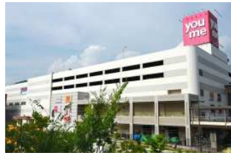
ゆめタウン呉 徒歩11分（約850m）