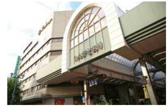
れんが通り商店街 徒歩5分（約390m）