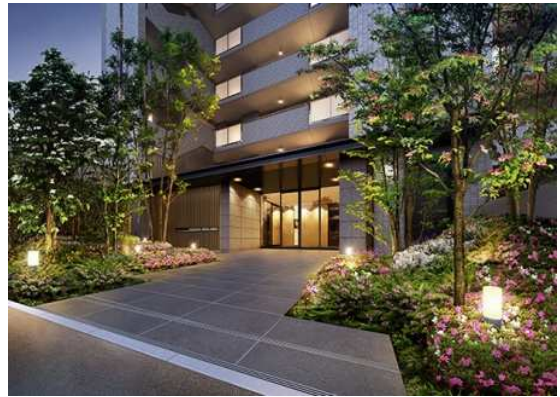
エントランスアプローチ