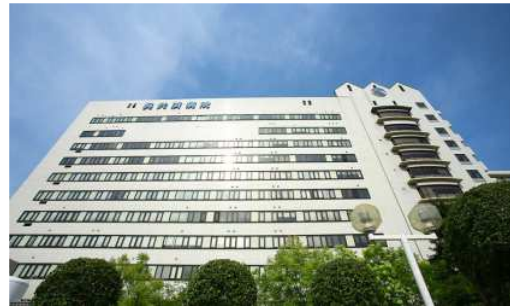
呉共済病院 徒歩4分（約320m）