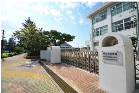
呉中央学園 徒歩10分（約800m）

学区内には市立の小中一貫校「呉中央学園」があります。小児科のある「呉共済病院」は徒歩4分（約320m）。公園や図書館もすぐ近くにあり、子育てファミリーにもうれしい住環境です。