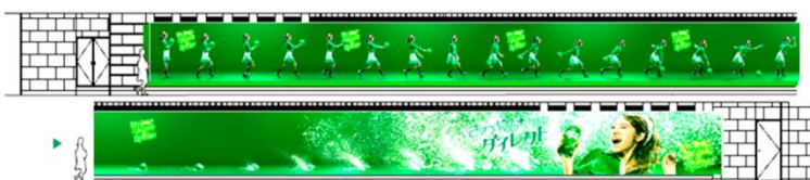
体験型屋外広告設置イメージ