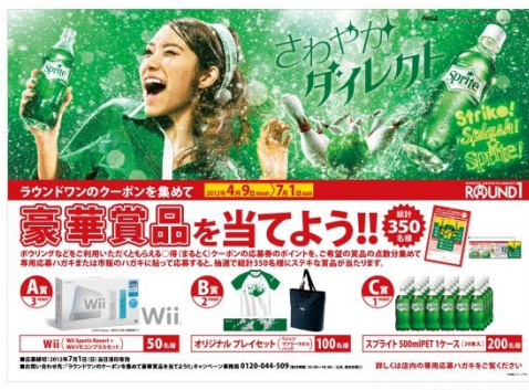
プレゼントキャンペーンポスター

[C 賞]クーポン 1 枚コース、スプライト 500mlPET1 ケース 200 名様