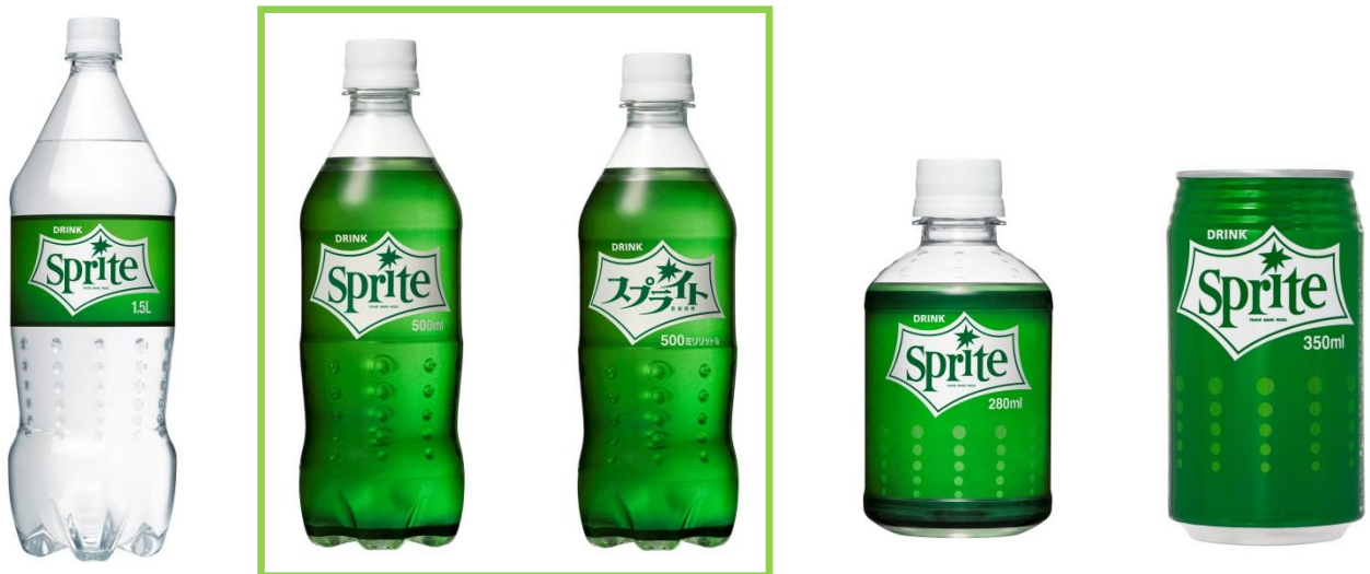
「Sprite」(無果汁)1.5LPET、500mlPET パッケージ表面(左)とカタカナのロゴを復刻した裏面(右)、280mlPET、350ml缶

また昨年の好評をうけ、今回のリニューアルにあわせて定番の350ml缶や500mlPETだけでなく、1.5LPETや280mlPETをはじめとしたフルラインナップで展開。多様なニーズを取り込むことで、新しい飲用者の拡大を目指します。