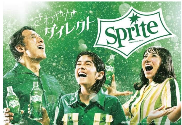
ストライクを取った瞬間の爽快感を表現した、新キャンペーン「Strike! Splash! Sprite!」のキービジュアル

本キャンペーンでは、“さわやかダイレクト”という瞬間的な爽快感を提供するという「スプライト」ブランドならではの特性を、多くの人に馴染みのあるボウリングでストライクを取った際の気持ちよさと重ね合わせて「Strike! Splash! Sprite!」と表現することをアイデアのベースとし、スプライトの登場した70年代の世界観の中で、TV-CMなど各種活動で表現しています。