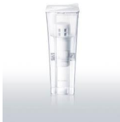
ポット型浄水器 クリンスイ CP012