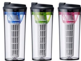
携帯型浄水器 クリンスイタンブラー TM804