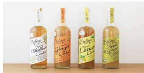
ハーブやフルーツ果汁を使ったイギリスの伝統的な ナチュラルドリンク「コーディアル」