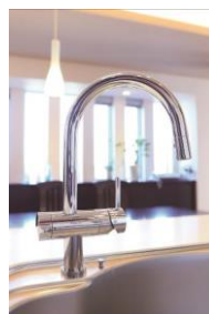
ビルトイン型浄水器 クリンスイ F914C1 *取付工事手配あり