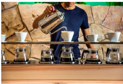
【ハンドドリップコーヒー】

クリンスイの浄水で淹れたコーヒーは香り豊かで、コーヒー豆の味をひきたてます。またクリンスイの浄水に最も合うようブレンドしたオリジナルコーヒー「MIZUcafe ブレンド」もお楽しみいただけます。(ハンドドリップコーヒー500 円/MIZU Café ブレンド 400 円)