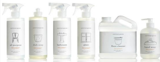
ニューヨークで人気の肌に優しいナチュラル クリーナーブランド「コモングッド」シリーズ