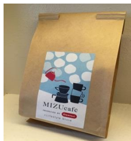
クリンスイの浄水に合う オリジナルコーヒー