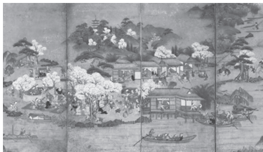
「淀橋本観桜図(部分)」(大阪歴史博物館蔵)

【会期】 平成27年7月25日(土)～8月31日(月) 会期中無休 【開館時間】 10時～17時(入館は16時30分まで) 【会場】 大阪くらしの今昔館 8階企画展示室