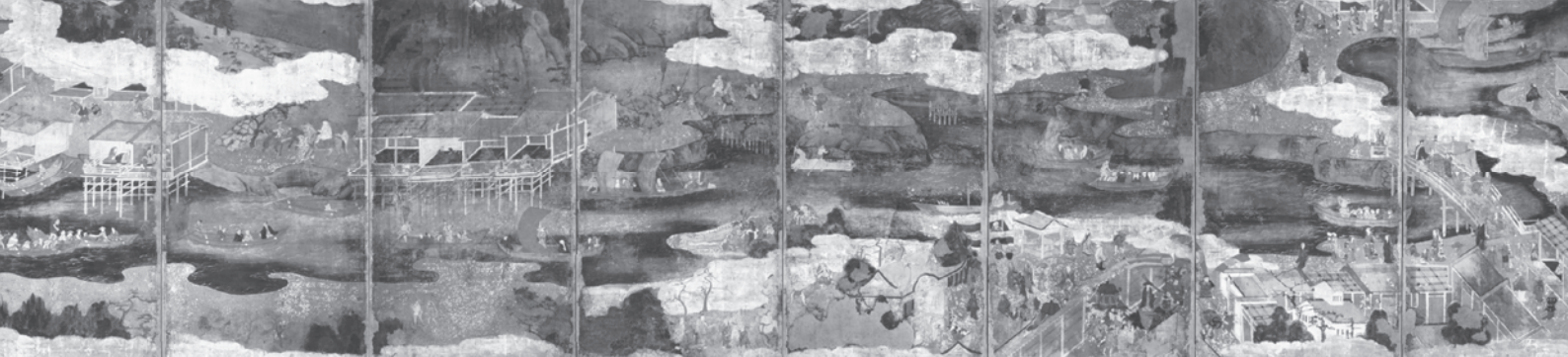
「淀川堤図」(大阪城天守閣蔵)