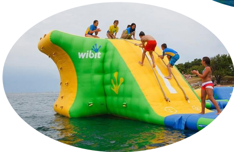
アクションタワー