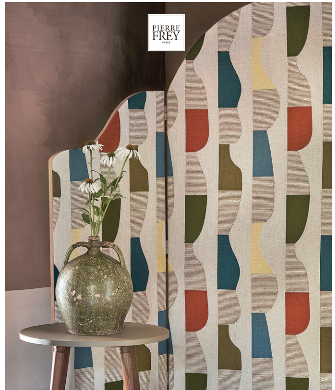
▲BENNY (ベニー) by 『LUMIÈRES BORÉALES』 ¥75,460/m 生地巾 146cm 60年代のレトロな美学を幾何学刺繍で現代的に表現しています。ダイナミックなパターンが、インテリアに遊び心とリズムを与えるデザインです。