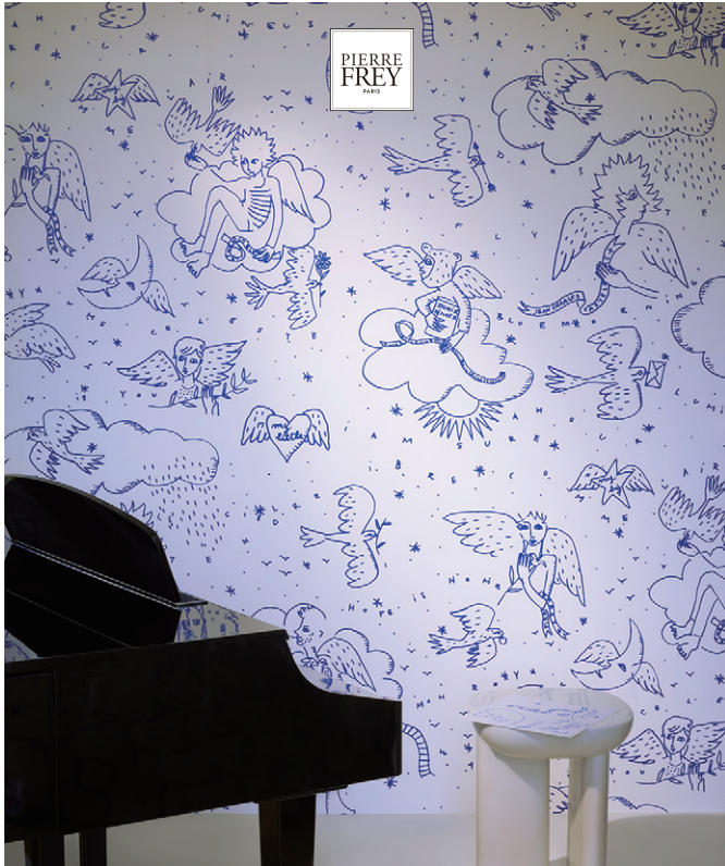
▲LE MONDE PARALL' AILE (ルモンド パラレル) 全2色 by 『LA COULEUR DE NOS RÊVES』 壁紙 ¥55,770/m 巾 134cm 不織布壁紙 (準不燃 2-3) 天使と鳥が共存する世界をトワール・ド・ジュイ風に表現しています。同デザインの刺繍のファブリックスがあります。