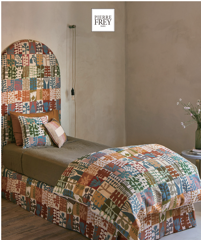
▲LES FEUILLAGES (レ フィヤージュ) by 『LUMIÈRES BORÉALES』 ¥55,660/m 生地巾 136cm アーティストのヴェロニク・ヴィラレの絵画を表現した、現代的な感性と洗練さを兼ね備える多彩な花柄のジャカードです。同デザインの壁紙があります。