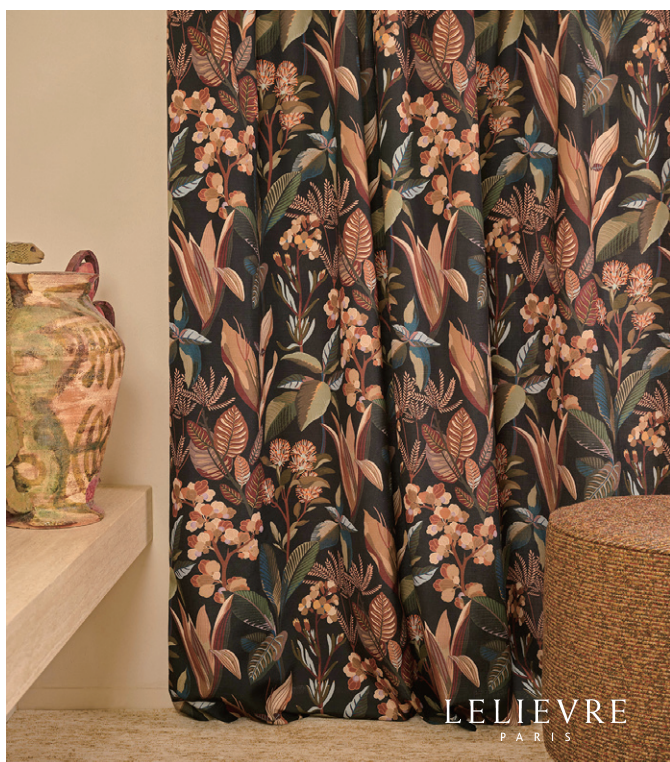
▲ L'OASIS（ロアジス）¥45,100/m 全3色 291 cm巾 コレクションの出発点となったこのデザインは、大胆な植物モチーフと対照的なカラーパレットが砂漠の中の豊かな自然を思わせます。柔らかく軽量で広巾のためカーテンにおすすめです。