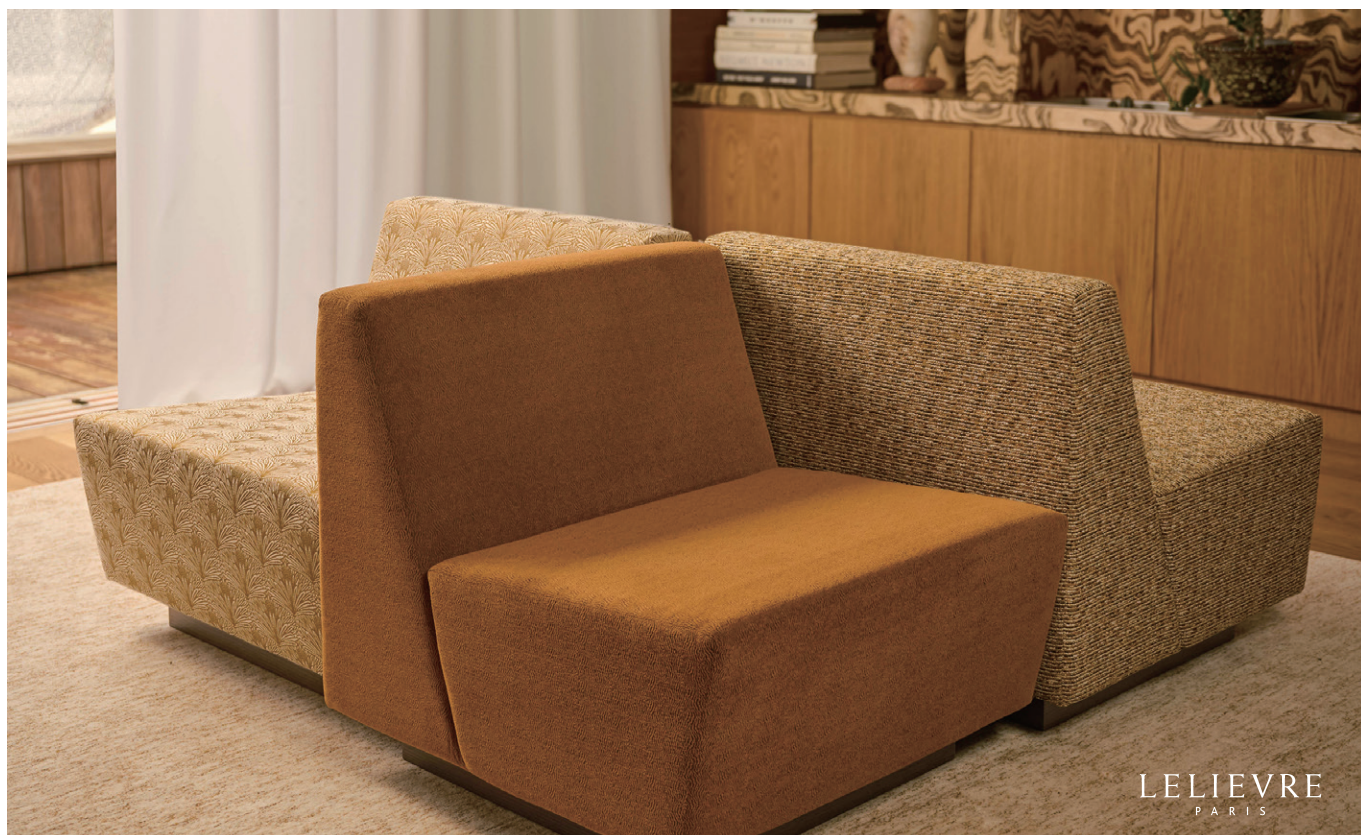
▲ 左：DATTIER（ダティエ）¥41,800/m 全6色 140 cm巾 ナツメヤシの葉のグラフィックなシルエットから着想を得た、太めの糸で構成した柔らかかでナチュラルな手触りが特徴のジャカードです。 中央：SUKKARI（スッカリ）¥30,800/m 全8色 141 cm巾 豊かなテクスチャーが魅力的で、小さなパターンがデーツにも樹皮にも獣毛にもみえる多義的なデザインのファブリックスです。 右：SORGHO（ソルゴ）¥33,110/m 全13色 140 cm巾 ツイードのような趣のある細かなブークレです。穀物やスパイスのようなニュアンスのカラーパレットと深い質感が特徴です。