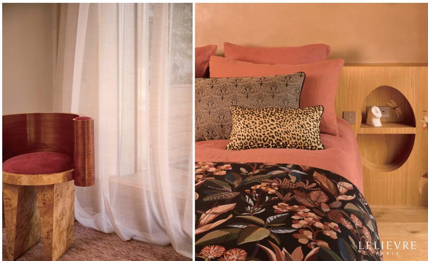
▲ 左 レース：ZAATAR（ザアタル）

素材のもつ温もり感・手触り・光の捉え方を多角的に探求した『コントレ ソヴァージュ』は、トミタトーキョーと大阪ショールームでご覧いただけます。