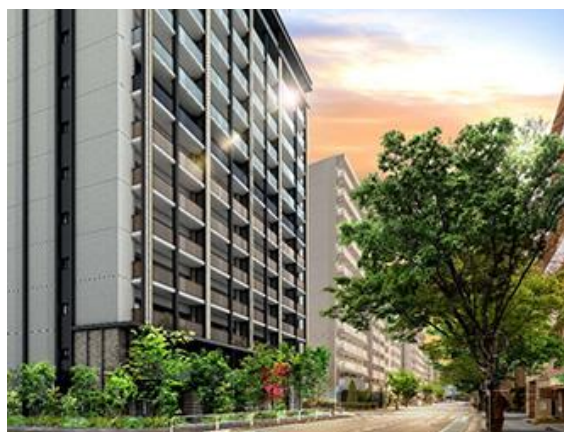
「プライム品川南大井」イメージ