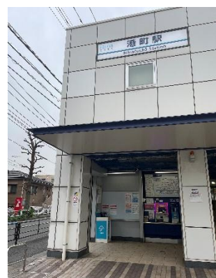
※設置した様子：京急田浦駅，安針塚駅，港町駅（左から順）