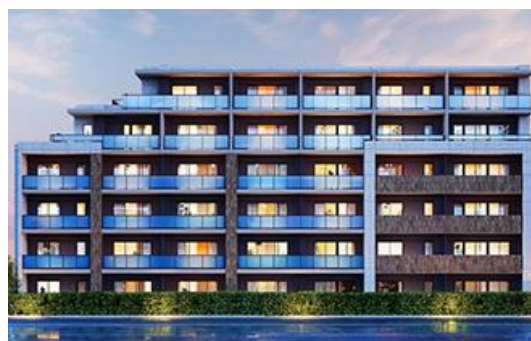
「プライム東神奈川」イメージ

ア ク セ ス 京急本線 京急東神奈川駅 徒歩 5 分 間 取 り 1LDK～4LDK 総 戸 数 全 59 戸 専 有 面 積 39.50 m 2 ～82.62 m 2