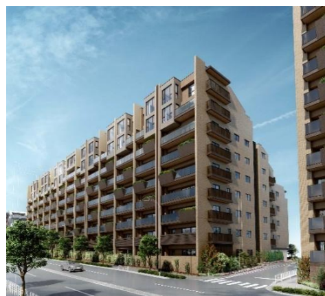
「プライム横浜」イメージ