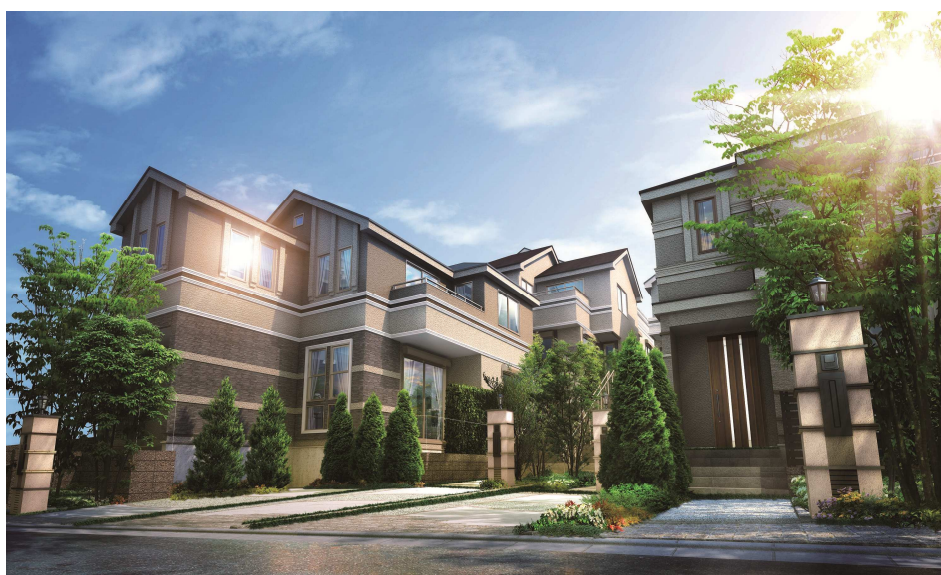
アリオンテラス百合ヶ丘 (外観完成予想図)