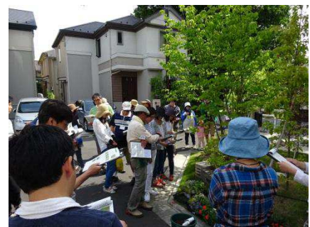
植栽お手入れセミナーの様子