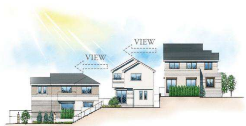
【ひな壇完成イメージ】

また建物の外観は、水平ラインを強調した「プレーリースタイル」をイメージしつつ、壁面の凹凸による装飾、外壁のアクセントカラーなどでデザインしています。モダンさの中に落ち着いた邸宅感を表現しています。