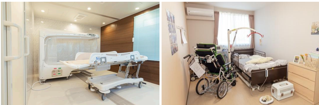
▲介護度に応じた浴槽(左)と居室イメージ(右)

当社は、2017年の創業以来、全国53カ所でサービスを展開し(2025年11月末時点)、がん末期やALS(筋萎縮性側索硬化症)、パーキンソン病、多系統萎縮症、その他の幅広い疾患、17症例7,100名以上の方をお受け入れしてきました(2025年3月末時点)。「ReHOPE 成田」は、 当社が千葉県成田市に開設する初の施設です (千葉県内では6施設目)。がんや難病ケアの専門知識とスキルを有するスタッフが在籍し、重い病とともに生きる方が充実したケアのもと、少しでも自分らしい生活を送れるようにサポートしていきます。