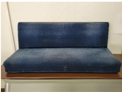
3人掛け座席（座ぶとん・背ずりふとん） 販売額 16,500 円（税込） 販売点数 1 点