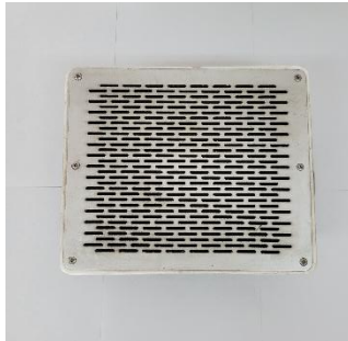
客室内スピーカー 販売額 11,000 円（税込） 販売点数 1 点