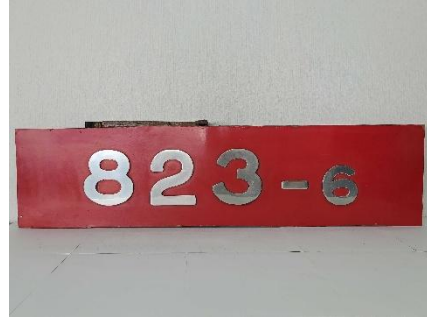
側面車番切り抜き 販売額 77,000 円（税込） 販売点数 1 点