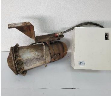
電子警報器・スピーカーセット（警報スピーカー） 販売額 55,000 円（税込） 販売点数 1 点