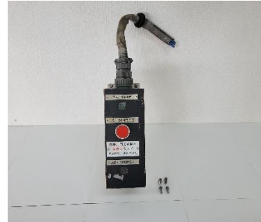
自動戸閉切放装置表示器 販売額 8,800 円（税込） 販売点数 1 点