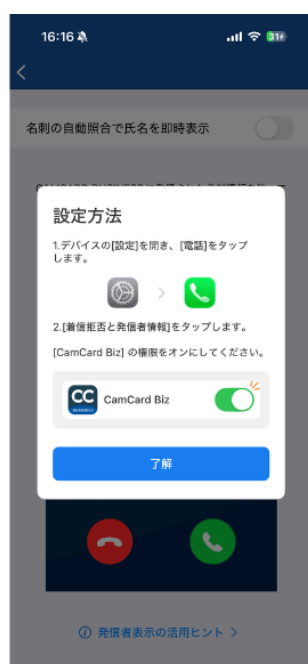
デバイスの設定から権限をオンに変更

特に営業担当者やカスタマーサポート部門において、着信時点で顧客ステータスを把握できるため、過去の商談履歴や対応状況を踏まえた質の高いコミュニケーションが通話開始直後から可能となり、重要なビジネス機会の損失を防ぎます。