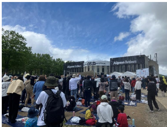
第 5 回目の「アルペンアウトドアーズ プレゼンツ『HAKUBA ヤッホー！FESTIVAL 2025』の様子

第 6 回目も新緑が芽吹く美しい 5 月に開催します。23 日（土）・24 日（日）の 2 日間に渡って開催するフェスティバルのフィナーレを飾る音楽ライブは、第 1 回目からプロデューサーを務めるキマグレンの「ISEKI」氏が担当。白馬の自然に魅せられた ISEKI 氏が手がける絶景空間での音楽ライブにどうぞご期待ください。