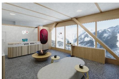
カワバシティ 8F 加熱式たばこ専用ラウンジ

詳細は glo™公式ウェブサイトのイベント特設サイトよりご覧いただけます。 https://www.myglo.com/jp/ja/event/kawaba/kawaba-2025