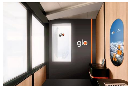
パノラマハウス 加熱式・紙巻たばこ喫煙所

BAT ジャパンは今後も 20 歳以上の喫煙者の方々に向けて、その多岐製品の選択肢を提供してまいります。従来の紙巻たばこから代替製品へ観点から「たばこハームリダクション」を推進することで、スモークレハな世界の情栄を日相しまり。