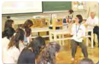
※写真は過去の分科会より。