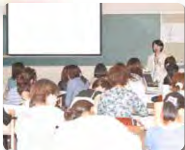
※写真は過去の分科会より。