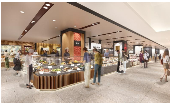
食料品フロア リニューアル後イメージパース