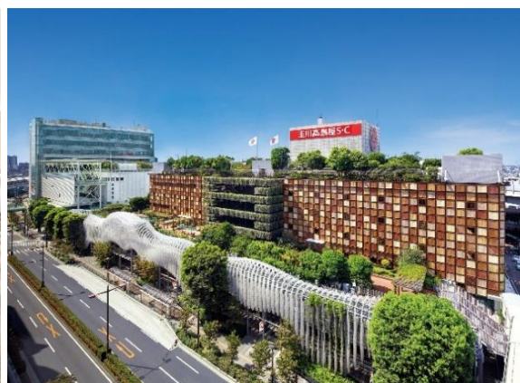
玉川高島屋 S.C. 外観