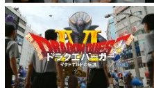
NA： ドラクエバーガー