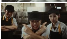
クルー 「メラゾーマ！」