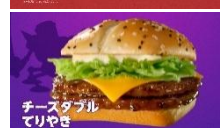
NA： チーズダブルてりやき