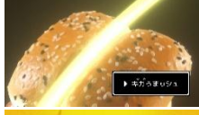
NA： ザク切りポテト肉厚ビーフ コンソメベツパーマヨ