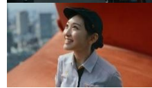
NA： ドラクエバーガー