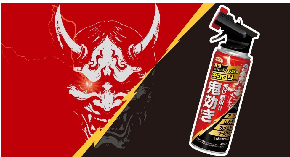
アースガーデン お庭の虫コロリ PRO 鬼効きジェット 480 ml

アース製薬株式会社（本社：東京都千代田区、社長：川端克宜、以下「アース製薬」）は、お庭のさまざまな害虫を手間かけずに長期間しっかり対策し、見かけた害虫もその場ですぐ駆除できる新製品『アースガーデン お庭の虫コロリ PRO 鬼効きジェット』を2026年1月20日（火）より全国で発売します。