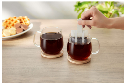
『KEY DOORS+ JET BREW』イメージ

配布物 : 『KEY DOORS+ JET BREW』オリジナルブレンド (1P)