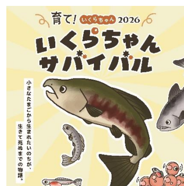
「育て！いくらちゃん 2026」キービジュアル

本企画展は、2014 年から開催している企画で、開催 11 回目を迎えます。今年は、「いくらちゃんサバイバル」をテーマに、京都水族館内を巡って特設パネルで学習し、サケの一生を学ぶ体験型ゲームが登場します。ここ数年、サケの来遊数・漁獲量は大幅に減少しており、今シーズンも非常に厳しい状況が続くと見込まれています。こうした問題を受け、展示を通して私たちの食生活に身近なサケを知るきっかけになってほしいと考えています。