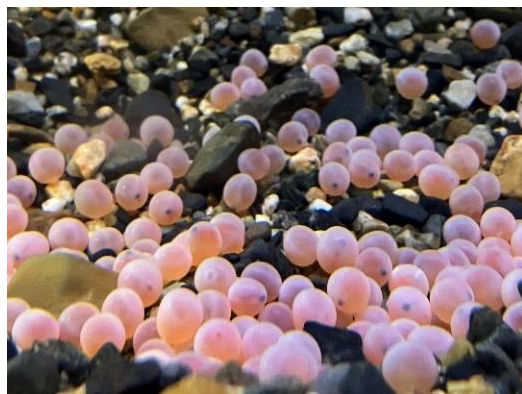
イクラの成長するようすを観察できる