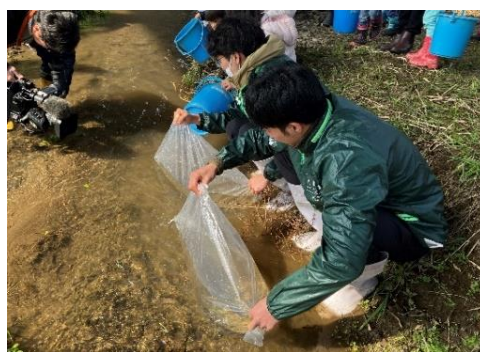
成長した稚魚を由良川に放流しているようす (2024年3月)

そこで今年は、サケを中心とした環境教育に取り組まれている「サケのふるさと 千歳水族館」にご協力いただき、千歳川へ遡上したサケのイクラを展示します。お預かりしたイクラは稚魚になるまで飼育し、3月中旬頃に千歳へお返しして千歳川で放流されます。