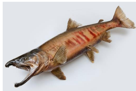
サケの成魚の剥製

あわせて、立派に成長した成魚の剥製をご覧ください。「いくらちゃん」が無事に成長すれば、やがて迫力ある成魚の姿になります。ぜひ大きくなったサケの姿にご注目ください。