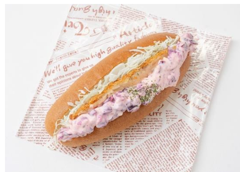
サーモンフライドッグ

ボリューム満点のサーモンフライを挟んだホットドッグが登場。カラフトマスを使ったサクサクのフライは、タルタルソースの中に刻んだ柴漬けが入ったソースをトッピングしています。サクッと食べやすいのに、おなかいっぱい満たされる限定飲食メニューをぜひお楽しみください。