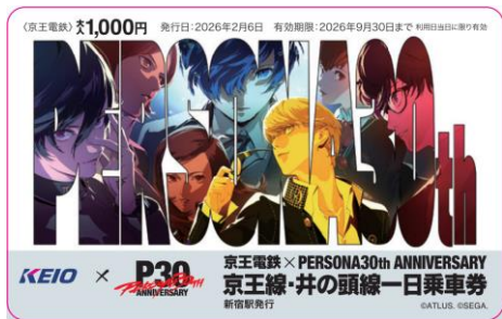
《京王線・井の頭線一日乗車券》