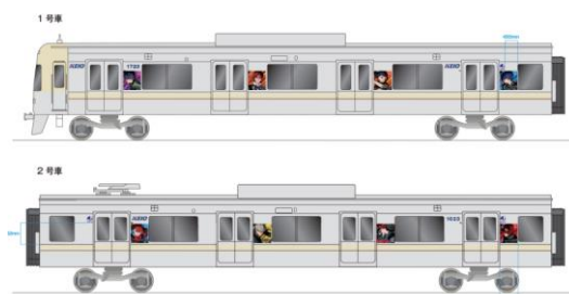
《ラッピング車両（イメージ）》