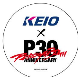
《ヘッドマーク（イメージ）》