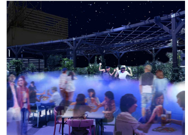
「TOKYO ISLANDS 深海のビアガーデン」イメージ

ルミネ新宿 では、ルミネ1屋上「RoofTop Beer Garden. 東京小空」とタイアップして、「TOKYO ISLANDS 深海のビアガーデン」を8月3日(月)～16日(日)の期間限定でオープン。噴射したミストがブルーにライトアップされた、まるで深海にいるようなロマンチックな空間が登場します。加えて、大画面で映し出される島の大自然。そして、東京の島々の特産品を使った特別メニューの数々。東京の秘境の島々の自然や文化がルミネ新宿の屋上で体験できます。