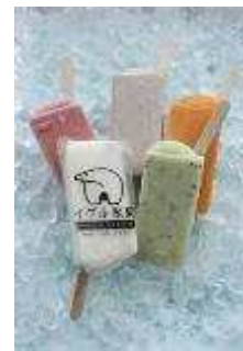
「アイスクャンデー」 186円(税抜) 「ジェラート」 371円(税抜)