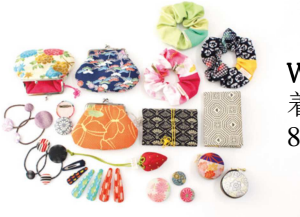
WATALIS「着物地雑貨」 着物地から作られる1点物。 800円(税抜)～