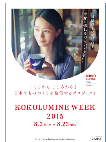
メインビジュアル