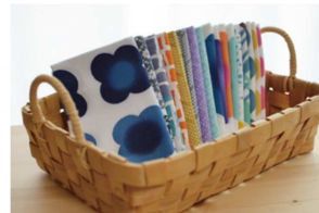
zucu「注染てぬぐい」 伝統工芸「注染」の手仕事の逸品。 800円(税抜)～