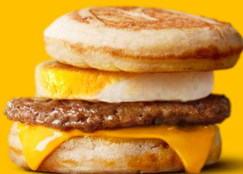
マックグリドル。ソーセージエッグ

メイプル風シロップ入りのパンケーキとソーセージパティ、たまご、チーズとの相性がクセになるマクドナルドのパンケーキサンド。