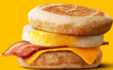
マックグリドル。ベーコンエッグ

朝食にパンケーキサンドという新しい朝食スタイルの提案です。パンケーキと香ばしいベーコンの相性がクセになります。