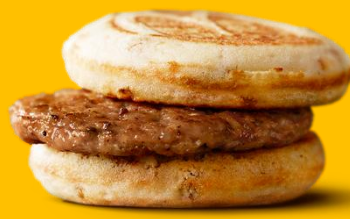
マックグリドル。ソーセージ

朝食にパンケーキサンドという新しい朝食スタイルの提案です。メイプル風シロップ入りのパンケーキとソーセージは相性抜群。