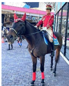
《警視庁騎馬隊との撮影会》