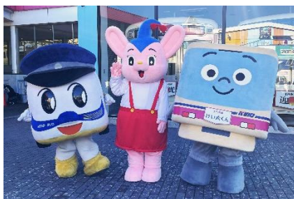
《キャラクターグリーティング》