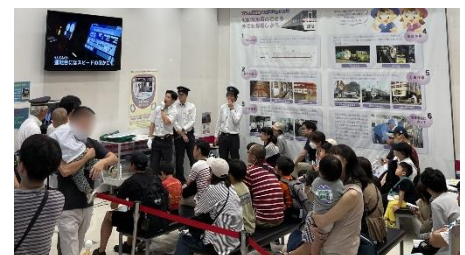
《安全教室（イメージ）》