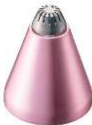
マユ用アタッチメント