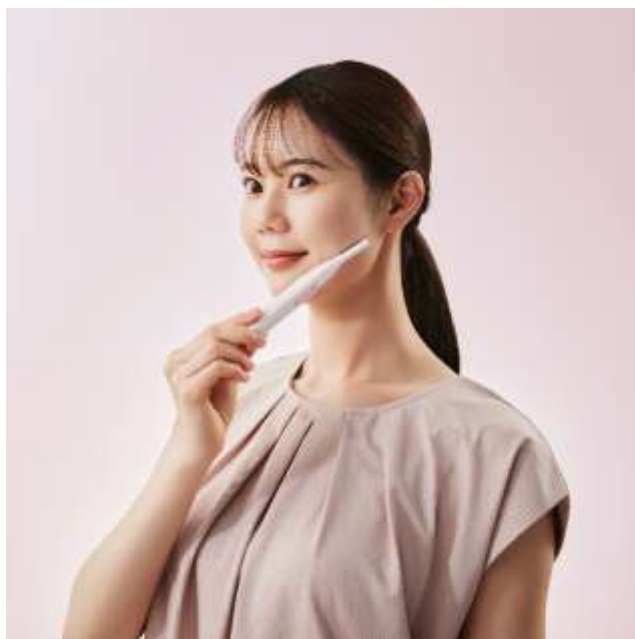
(写真上から) MXFS-200.BE (ベージュ)、 MXFS-200.WH(ホワイト)

マユ近くの細かな部分から頬などの幅のある面まで、お手入れしやすい形状で肌の曲面にフィットする、やさしい剃り心地のフェイス専用シェーバーです。