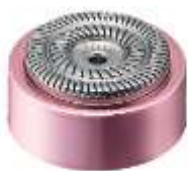
フェイス用アタッチメント