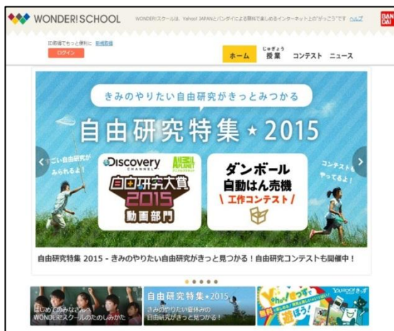
WONDER!スクール 自由研究特集☆2015