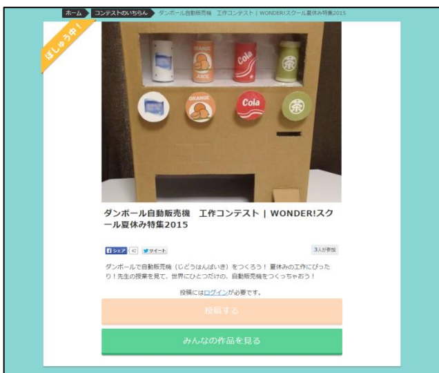
WONDER!スクール「ダンボール自動販売機 工作コンテスト」

今子どもたちの中で流行となりつつある、ダンボールでつくる自動販売機。「ダンボール自動販売機 工作コンテスト」は、WONDER!スクールの「自由研究特集☆2015」内で展開されているコンテストのひとつで、手作りのダンボール自動販売機の写真や動画を投稿することによって応募することができるコンテストです。このコンテストページ上では、応募の場を設けているだけではなく、動画サイト YouTube で約 30 万視聴もあるダンボール自動販売機の作り方動画を、WONDER!スクールユーザーに向けたバージョンで公開しているほか、作り方のアドバイスや、完成した作品を紹介する動画の公開など、実際の作りかたをいちらから学ぶことができます。