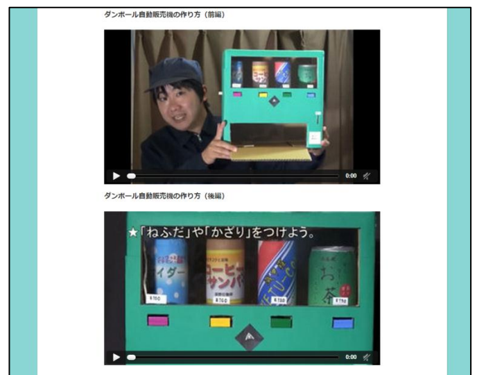
ダンボール自動販売機の作り方も、動画で学べます