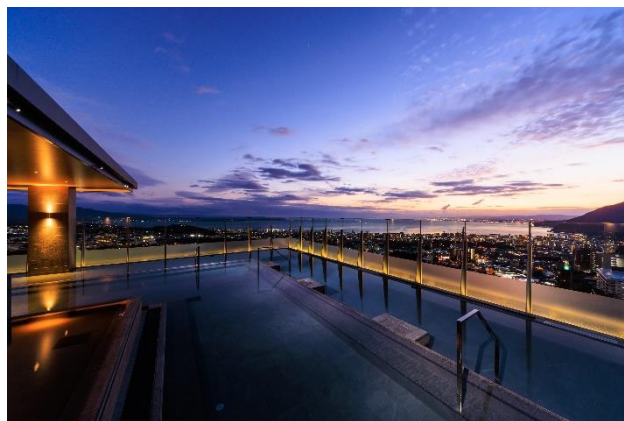
宙館 展望露天風呂「宙湯」

今回受賞した取り組みは、2023 年 1 月 26 日に開業した「別府温泉 杉乃井ホテル（大分県別府市）」のフラッグシップ棟「宙館（そらかん）」における、省エネルギーおよびエネルギーマネジメントの事例です。336 の客室を有する「宙館」では、省エネ設備・制御の導入や、地熱エネルギーの有効活用などにより、CASBEE *1 （新築）の最高評価である S ランクを取得するとともに、ZEB Oriented *2 の認証を取得しています。建物仕様にとどまらず、開業後も約 3 年間にわたり、事業主・設計者・運営会社が一体となってエネルギーマネジメントを継続的に実践した点が、省エネルギー性の高いホテル運営を実現したとして評価されました。