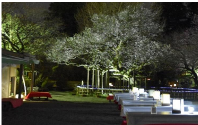
《ライトアップされた寿昌梅》