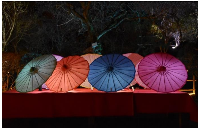
《番傘ライトアップ》