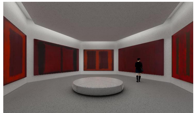
G4115

国際文化会館の新西館に開設する常設展示室「ロスコ・ルーム」の設計を手掛ける建築ユニット SANAA（※添付資料 1）には、DIC 川村記念美術館や米国のロスコ・チャペル、英国のテート・モダンのロスコ空間をご訪問いただき、作品と空間の在り方について深く理解を深めていただきました。