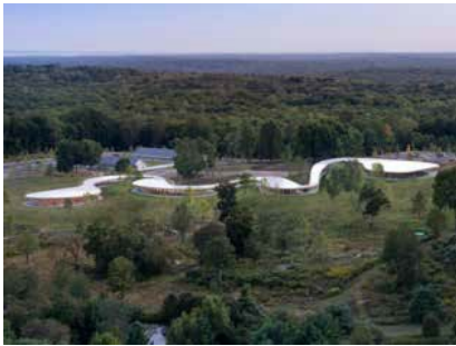
グレイス・ファームズ