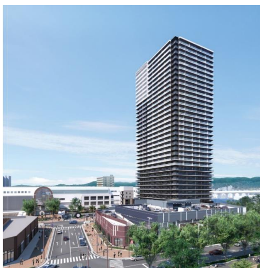
【久留米ザ・タワー レジデンシャル（イメージ）】

なお、本物件は 2026 年 3 月 13 日に第 3 期 1 次登録の申込受付を開始する予定です。