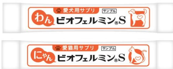
配布するサンプル品

当社ブースでは、愛犬のお写真が撮れるフォトスポットや商品展示などをご用意。また、ペットオーナー様からのご要望を受け、サンプリングも実施します。この機会に是非お越しください。