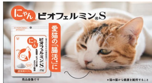
猫用健康補助食品

大正製薬は、本年2月21日(土)より Aichi Sky Expo(愛知県国際展示場)で開催される、東海地区最大級のペットイベント「わんにゃンドーム2026」に、「わんビオフェルミン S」と「にゃんビオフェルミン S」を初出展します。