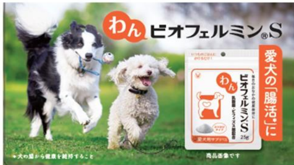
犬用健康補助食品