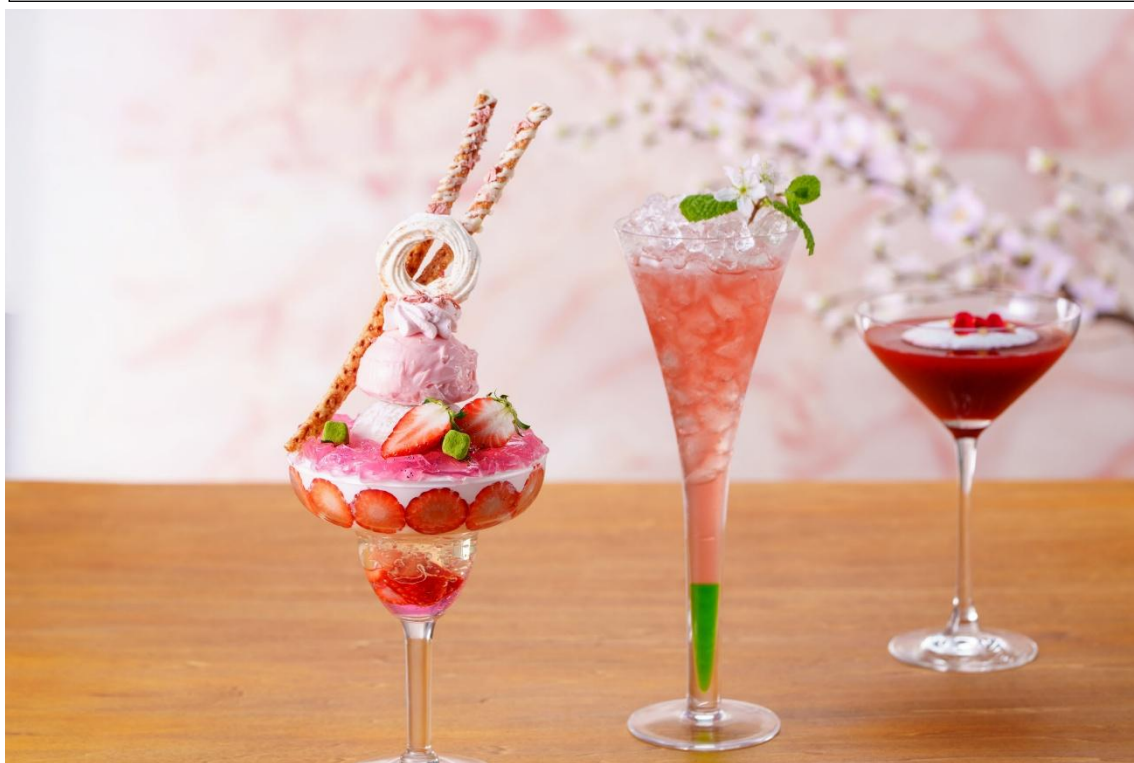
「Spring Parfait & Cocktail」イメージ

ウェスティンホテル仙台(仙台市青葉区一番町、総支配人 下重 和之)では、2026 年 3 月 14 日(土)～5 月 15 日(金)の期間、26 階の開放的なラウンジ&バー ホライゾンにて、桜といちごをテーマにした「Spring Parfait & Cocktail」を発売いたします。