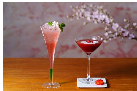
「スプリングカクテル」イメージ

「STRAWBERRY(写真右)」は、いちごとエルダーフラワーのリキュールをシェイクし、いちごを添えました。いちごの味わいを存分にお召し上がりいただけます。