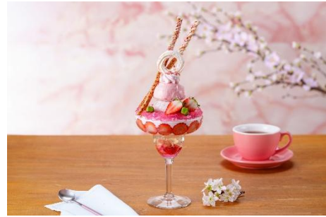
「スプリングパフェ ～SAKURA Strawberry～」イメージ

季節のフルーツや食材が持つ美味しさを最大限に引き出した、パティシエのイマジネーション光るパフェ。Punks Farmer の鮮やかないちごに、抹茶を組み合わせ、ストロベリーアイスクリームやいちご、白ワインジュレを重ねています。さらに、内部には、求肥で包んだアイスクリームや抹茶のシフォンケーキを忍ばせました。