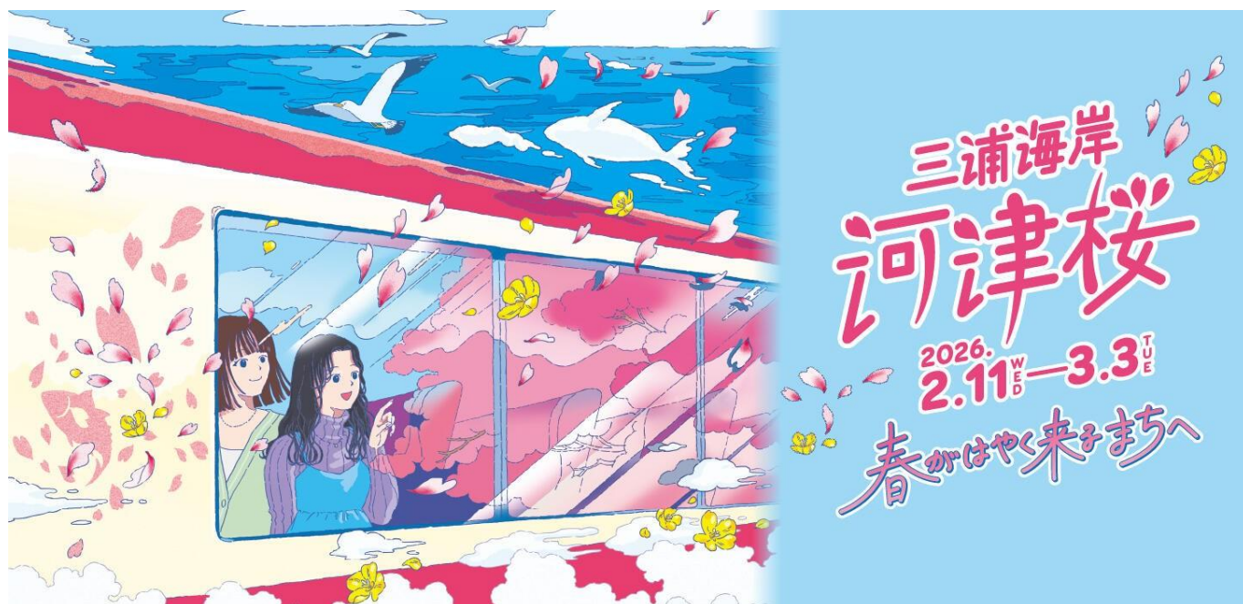
キャンペーンビジュアル