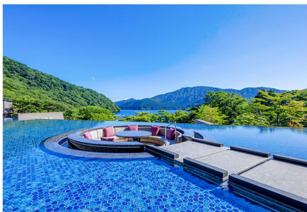
箱根・芦ノ湖 はなをり