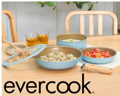
ドウシシャ evercook fit IH対応 着脱式 フライパン8点セット (1句)

オリックスグループの全国各地のお取引先企業より、「働くパパママ川柳」に共感いただいた3社の皆さまにご協賛いただき、「働くパパママ」を応援するプレゼントをご用意しました。