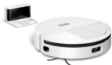
家族時間を増やす時短家電 アイロボット Roomba 205 DustCompactor Combo ロボット ホワイト

働くパパママを応援する 3 つのプレゼントをご用意しました。ご家族のライフスタイルに合わせて、3 種類の賞品から 1 つお選びいただけます。