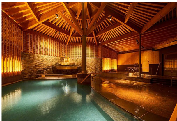
函館・湯の川温泉 ホテル万惣

副賞 ORIX HOTELS & RESORTS の 4 施設から選べる 1 泊 2 食付きホテル宿泊券（1 組 2 名様分）