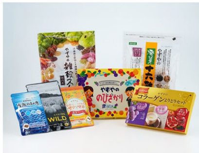
やずや 毎日の元気応援セット (1句)