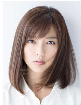
真野 恵里菜さん (俳優)