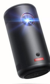
家族時間を豊かにするお楽しみ家電 アンカー・ジャパン モバイルプロジェクター Nebula Capsule 3