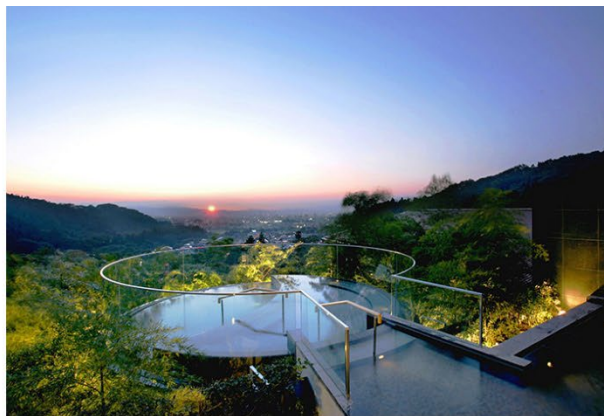
会津・東山温泉 御宿 東鳳