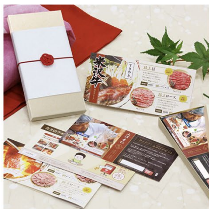
家族で楽しめる贅沢グルメ さがえ精肉 厳選米沢牛 カタログギフト 5万円コース