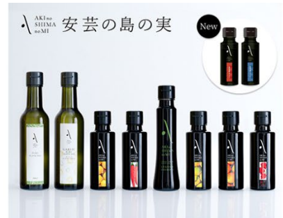
リベラグループ 安芸の島の実 オリーブオイルセット (1句)

※ 賞品に関する注意事項は、 「オリックス 働くパパママ川柳」ウェブサイト をご覧ください。