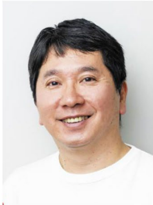
田中 裕二さん (タレント「爆笑問題」)