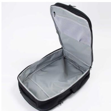
クラムシェルオープン