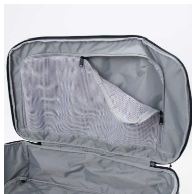
ジッパーポケット