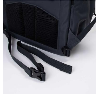
取り外し可能なウエストベルト