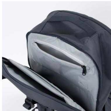
独立型PCコンパートメント