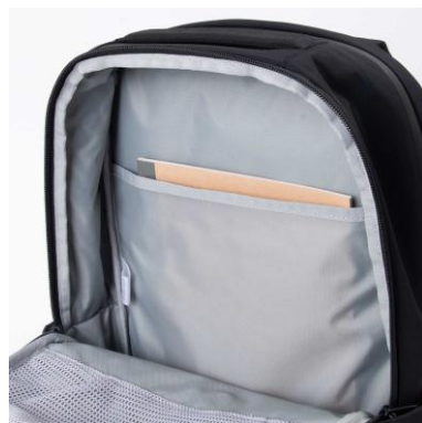
スリーブポケット付き メインルーム