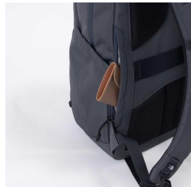
セキュリティポケット