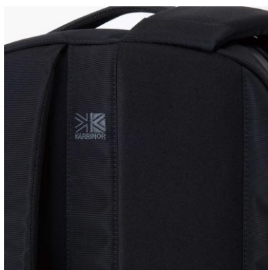
裏面ジャージニット素材の ショルダーハーネス