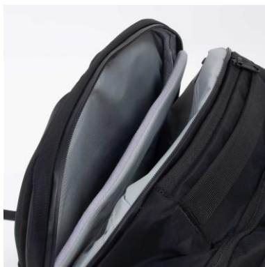
独立型PCコンパートメント