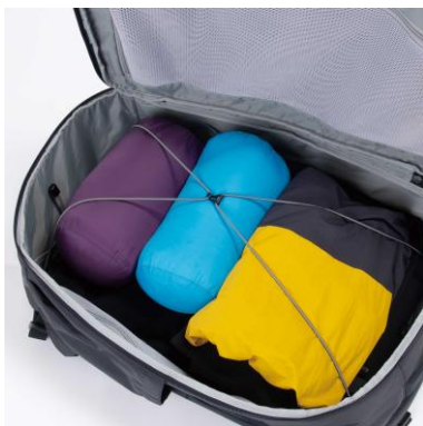
固定バンジーコード