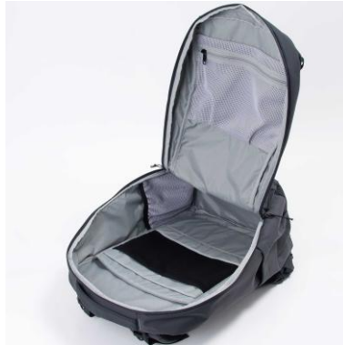
クラムシェルオープン