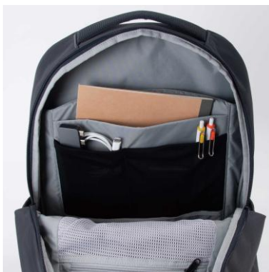
メインルーム内 ジッパーポケット