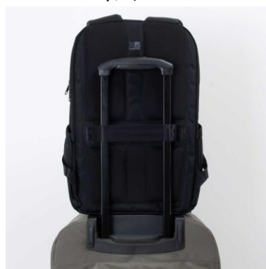
アタッチメントバンド