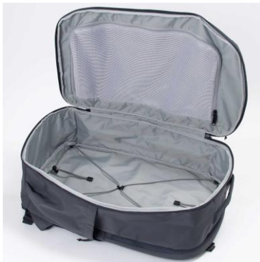
クラムシェルオープン