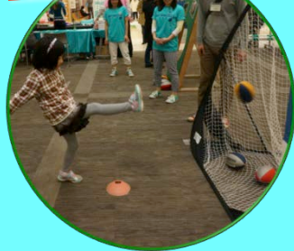
アトラクション① キッカー体験