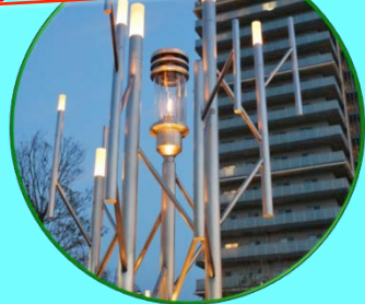
アトラクション② 奏の杜クイズ