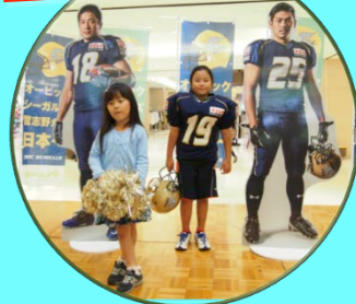
アトラクション③ 選手なりきり体験