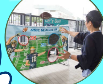
アトラクション④ 的あて体験