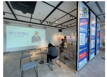
展示イベント（昨年度の様子）

【内容】慢性腎臓病（CKD）の早期発見・予防方法や治療等についての展示（タペストリ、パネル、動画）