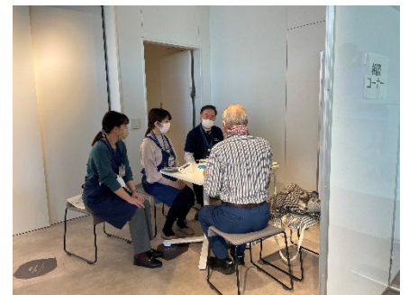
参加型イベント（昨年度の様子）

本学の医師および横浜市の保健師が、腎臓に関する治療、検査結果の見方、生活習慣の改善（例：食事、運動）などの健康相談に応じます。