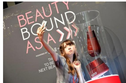
自撮りを楽しむクリエイターも

自らが作った動画を SNS 上に定期的にアップするビデオ ブロガーを「Vlogger (ヴロガー)」と呼び、オン・オフライン問わずその影響力は世界中で増大しています。「元祖ビューティ ヴロガー」と言われるミッシェル・ファンさん(アメリカ)は YouTube において約 780 万人、Instagram において 190 万人ものフォロワーを抱えており、日本を代表するビューティ ヴロガーの佐々木あさひさんも約 393,000 人の YouTube フォロワーを抱えています。Instagram も動画投稿サービスを開始、Facebook では 2014 年の 1 年間で動画の投稿が 75%増加と、SNS 界において動画の存在感が急激に増加している流れも相まって、「ビューティ×動画」が今後グローバルのビッグトレンドになることは必須となるでしょう。