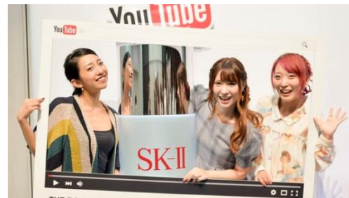
先輩クリエイターの表現力はさすが!

近年目覚ましい発展を遂げている SNS。ファッションにおいては、Instagram、Pinterest などの画像投稿アプリを活用するのは今や当たり前となっていて、そこから発信された画像が人を動かしたり、現実でもニュースやトレンドになったりしていますが、これから注目されているのが「ビューティ×動画」です。ファッションとは異なり、スキンケアやメイクアップはプロセスを知りたいと願うユーザーが多く、そのプロセスを分かりやすく、効率よく見せる事ができる方法が「動画」です。また、たとえ言語が違って、目で見て分かる・交流できる「動画」は、国境を越えて注目の的なのです。