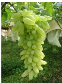
ゴールドフィンガー (伊藤ぶどうファーム)