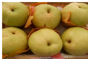
特大かおり梨 (野美屋)