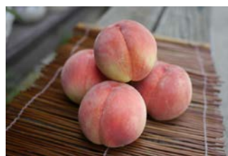
桃 (日本橋ふくしま館 福島県×ANA)