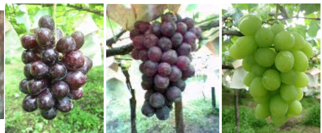
マスカットオブアレキサンドリア・ヒロハンプルグ・ハイペリー (南アルプスファームフィールドトリップ)