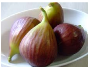
イチジク (なかいや農園)

その他にも「なかいや農園」の採れたてのイチジク、「新津ファーム」から山梨県産のイチジク、カリフォルニアブラック(黒イチジク)とヌアールドカロンが届きます。南房総最大のパッションフルーツ農場「RYO'S FARM」からは美肌効果のあるパッションフルーツ、「ブルーベリー農園そら」から農薬不使用の完熟ブルーベリーで造ったワイン「日本橋ふくしま館 福島県×ANA」は福島を代表する桃を販売します。