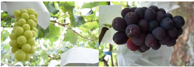
シャインマスカット・ピオーネ (天野ぶどう園)

山梨県の「天野ぶどう園」からデラウェア、巨峰、シャインマスカット、ピオーネ、甲斐路(かいじ)などが、「南アルプスファームフィールドトリップ」からはバラデー、甘太郎、ヒロハンプルグ、瀬戸の花嫁、山形県の「安達農園」からナイアガラ、長野県の「伊藤ぶどうファーム」からナガノパープル、黄華(おうか)、ベニバラード、ゴールドフィンガーなどとバリエーション豊富。梨も「鳥取いわしや」から鳥取県産の二十世紀梨と新甘泉(しんかんせん)、「いいもんマルシェ」から奈良県産の勝ちどき梨と豊水が、「野美屋(やおや)」からは昭和天皇献上品でもあり、超希少な東京都府中産の特大かおり梨が、りんごは「マルシェ東京」から青森県産のりんご、津軽や恋空、ミキライフ、黄王(きおう)が出品されます。