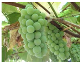
ナイアガラ (安達農園)