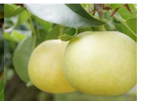
勝ちどき梨・豊水梨 (いいもんマルシェ)