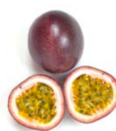
パッションフルーツ (RYO'S FARM)